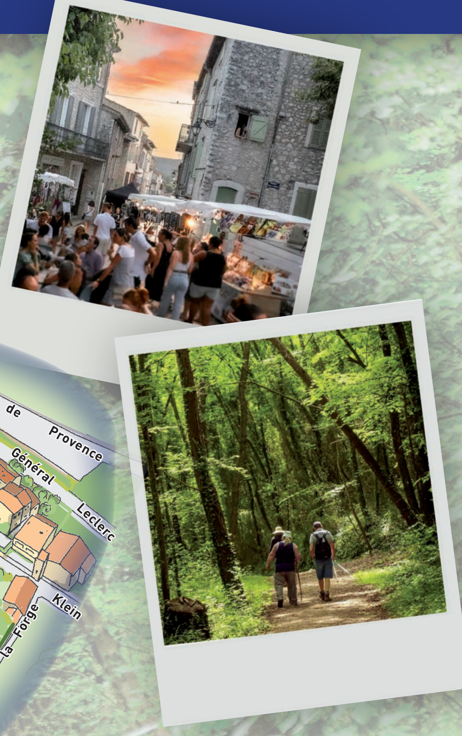
Illustration: Carionard - Toute reproduction même partielle interdite sans autorisation - 1° Edition: 08/2025